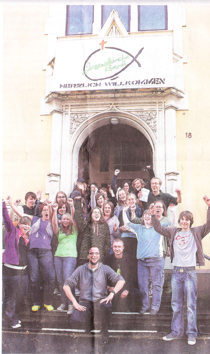
Seit dem Vorjahr ist die Jugendkirche an der Wilhelm-Strauß-Straße geöffnet. Ein Teil der Veranstaltungen findet im Franz-Balke-Haus statt.